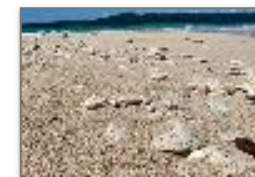
Coralli e conchiglie Nosy Fanihy