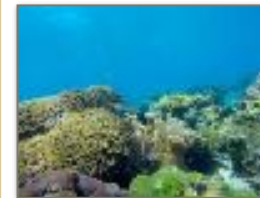
Fondale marino Nosy Tanikely

Le isole più belle dell'arcipelago. Nosy Tanikely parco marino, la più piccola delle isole, ma offre uno dei fondali più ricchi e spettacolari, sul quale avrete la fortuna di fare uno snorkeling guidato e rilassarvi in spiaggia. Poi l'isola di Nosy Komba, famosa per l'artigianato locale e la presenza dei simpaticissimi lemuri Macaco.