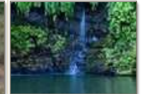
Cascata Sacra Nosy Be