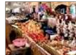
Il mercato di Hell Ville

Una mezza giornata folkloristica nella capitale di Nosy Be. Hell Ville, città colorata e profumata, shopping tra piccoli Bazar per poter comprare simpatici souvenir visitare il coloratissimo mercato ricco di odori tra cui, pepe, zenzero, zafferano. Visita all'Albero Sacro, importante culto per la religione animista. Entrerete all'interno di questo Ficus di circa 5 mila mq con tipici abiti malgasci, una vera esperienza malgascia!