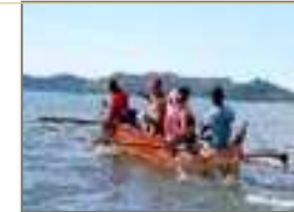
Viaggio in piroga

Passando dalle mangrovie esistenti con la piroga arriverete su una spiaggia con un piccolo rinfresco. Da qui, a piedi e con una guida esperta vi inoltrerete tra palme e piante medicinali alla ricerca delle diverse specie animali che popolano la foresta rane, camaleonti più piccoli al mondo, lemuri, boa constructor e uccelli vari.