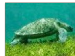
la tartaruga verde gigante

L'isola presenta bellissime calette e vi offrirà l'esperienza unica di nuotare con le tartarughe verdi giganti in un luogo particolare chiamato « La piscina ».