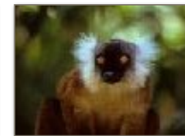
Lemure Macaco femmina Nosy Komba