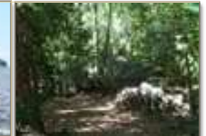
La foresta di lokobè