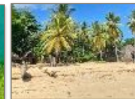
La spiaggia di Sakatia