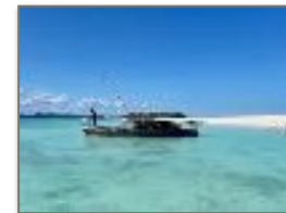
L'acqua cristallina di Nosy Iranja

Nosy Iranja, una delle isole più belle al mondo, offre uno dei paesaggi più suggestivi. Iranja Be e Iranja Kely sono collegate da una lunga lingua di sabbia bianca fine. Grazie al fenomeno della marea è possibile fare una piacevole passeggiata. In cima ad Iranja Be oltre ad esserci diversi punti panoramici è presente un faro costruito da Gustavo Eiffel.